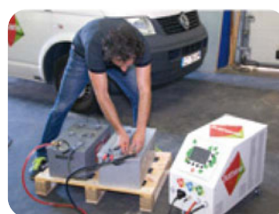
Accessoire : sonde de température batterie