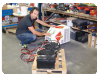
Interface et prise en main intuitive